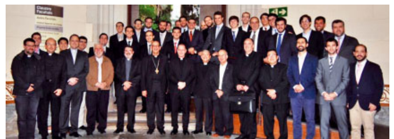
Seminaristes i formadors, a la celebració de final de curs