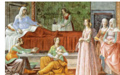
Naixement de sant Joan Baptista (s. XV) de Domenico Ghirlandaio

E l 2n Càntic del Servent de Déu presenta un personatge amb missió universal: els pobles llunyans . La crida té lloc ja abans de néixer : és acció de Déu que ve de l'eternitat. Però la presa de consciència del qui és cridat té lloc en un moment concret de la seva història.