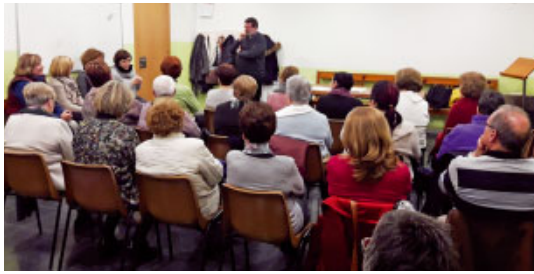
Formació de catequistes a Sant Boi de Llobregat